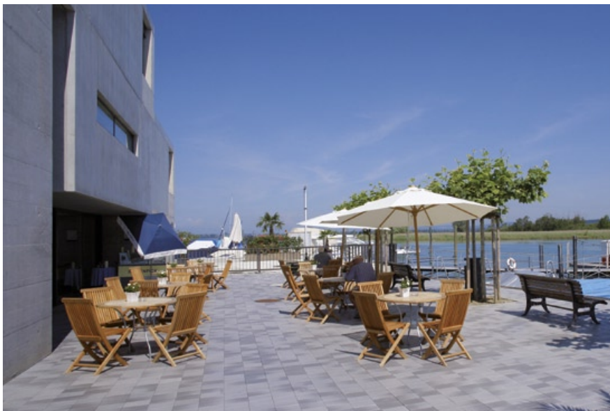
ÜBERBAUUNG „RIETBLICK“, SEECAFÉ ESPENSTRASSE 9