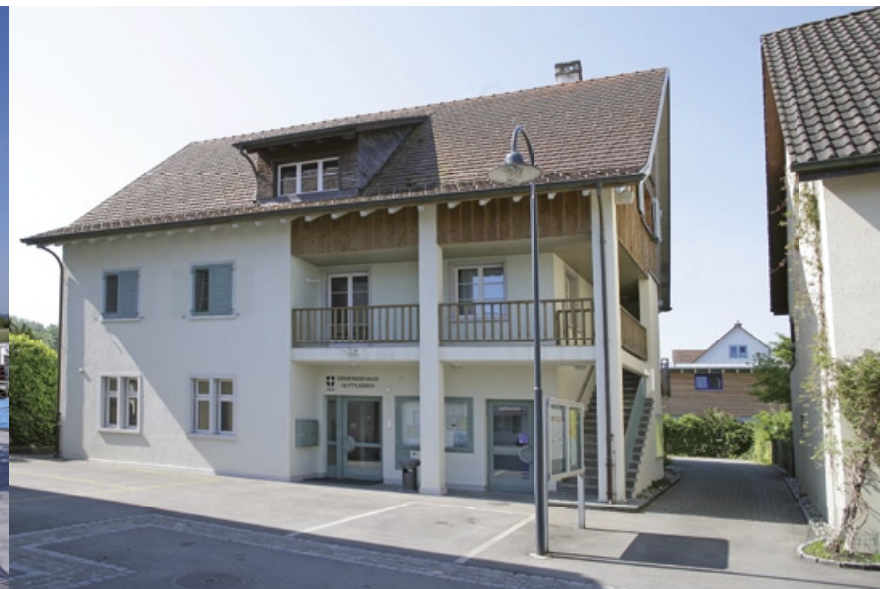
GEMEINDEHAUS GOTTLIEBEN KIRCHSTRASSE 11