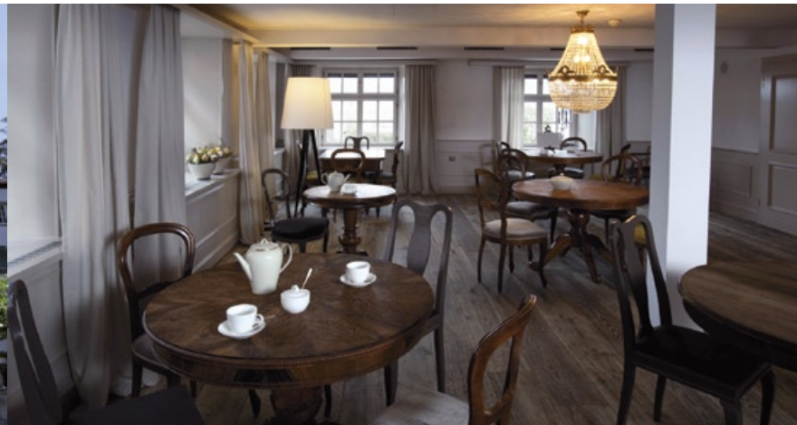
ROMANTIKHOTEL DIE KRONE SEESTRASSE 11 19