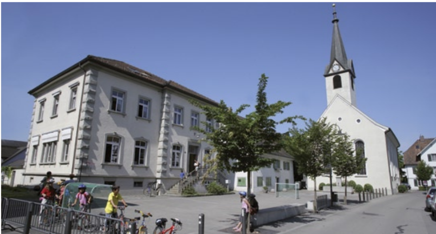
GESAMTSCHULE / REF. PFARRKIRCHE KIRCHSTRASSE 7