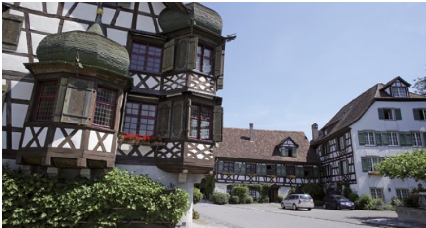
HOTEL DRACHENBURG & WAAGHAUS AM SCHLOSSPARK 7/10 17/18