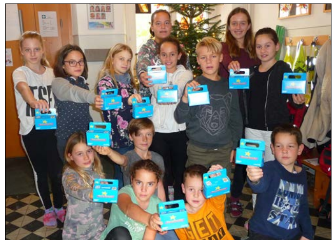
Mit berechtigtem Stolz zeigen die Gottlieber Schulkinder ihre vollen Spendenböxli.