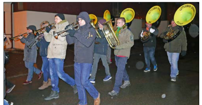
Die «Schnooggen» in ihrem Element.

Bei ihrem Weckdienst unterstützt wurden die Kinder wiederum von der Guggenmusik «Gottlieber Schnoogge», welche trotz des Umzuges des Probe-lokales ins ehemalige ARA-Gebäude in Tägerwilen Gottlieben wie versprochen weiterhin die Treue hält und ihrem Namen alle Ehre macht. (mb)