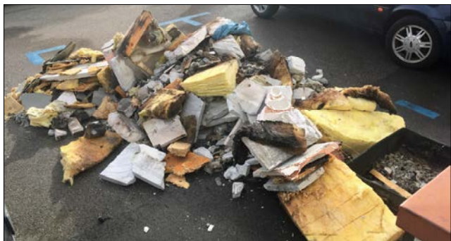
Überbleibsel auf einem Parkplatz an der Kirchstrasse zeugten vom Brand.