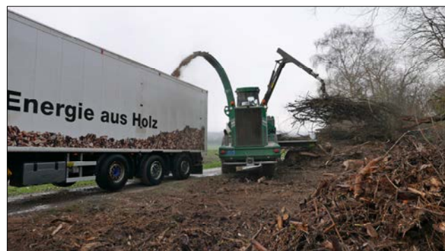
Grosses Gerät war notwendig, um das Sturmholz zu beseitigen.