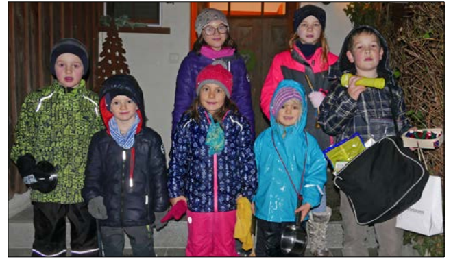
Die Gottlieber Silvesterkinder 2018.

Während das «gemeinsame Rutschen» um Mitternacht für Gottlieben zumindest in dieser Form eine Premiere bedeutete, hat das Silvesterwecken der Kinder am frühen Morgen des letzten Tages im Jahr eine lange Tradition – eine Tradition, die erfreulicherweise von Generation zu Generation weitergegeben und -gepflegt wird.