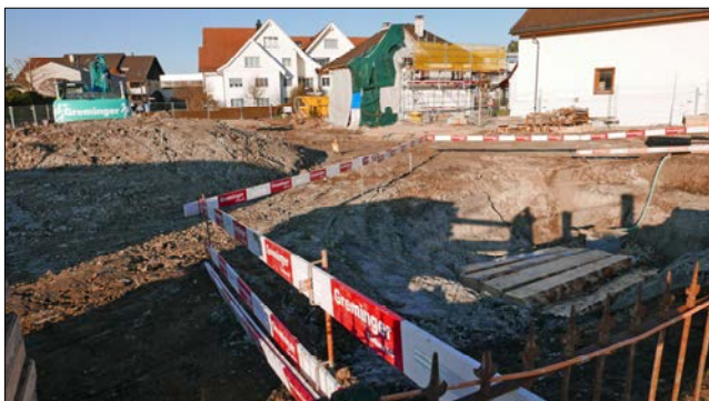
In der «Lohstampfe» ist der Baugrund wie überall am See anspruchsvoll.

Auch auf dem Areal «Lohstampfe», das zwar bereits zu Tägerwilien gehört, aber unmittelbar benachbart ist, sind die Bauarbeiten in vollem Gange.