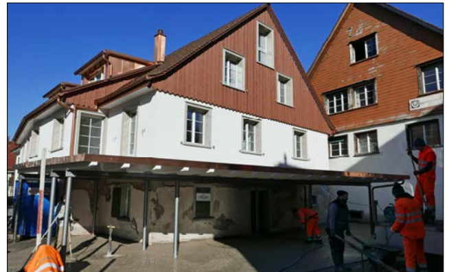
Die einst brandgeschädigte Liegenschaft an der Kirchstrasse 10 erstrahlt bald in neuem Glanz.

Wie Daniel Dalla Corte weiter ausführte, muss der Baugrund, wie in Seenähe üblich, mit Injektionspfählen gesichert werden. Mit dieser Technik entstünden keine Erschütterungen, ausgenommen durch einige wenige punktuelle und kurze Belastungstests. Es wird damit gerechnet, dass die Bauarbeiten bis im Sommer 2020 abgeschlossen sein werden. Dabei sollen einzelne Elemente aus den jetzt abgebrochenen Teilen einer neuen Nutzung zugeführt werden, beispielsweise die Bruchsteine aus dem ursprünglichen Fundament.