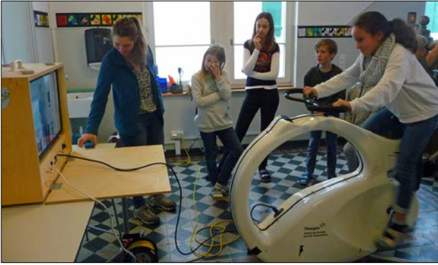
Auch das Experimentieren kam nicht zu kurz.