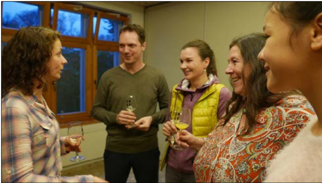
Der Neujahrsapéro bot wieder Gelegenheit für angeregte Gespräche.