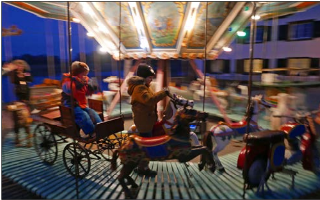
Die Kinder genossen den kühnen Ritt oder die schwungvolle Fahrt mit dem Nostalgie-Karussell.