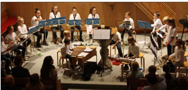
Schon nur der Anblick war ein Genuss.

Was ist Energie? Wo begegnen wir Energie im Alltag? Welche Wirkung hat unser Energieverbrauch? Die erlebnisorientierte Erarbeitung solcher Fragen stand an diesem Morgen im Mittelpunkt. Es war ein sehr spannender und abwechslungsreicher Morgen, an dem auch das Experimentieren nicht zu kurz kam. (jr)