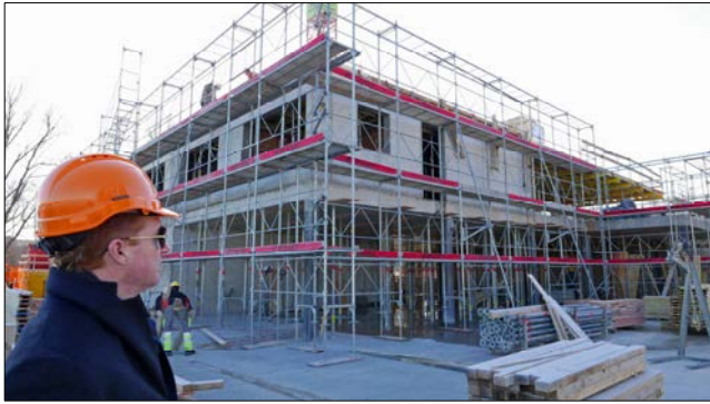
Markus Krüger ist zufrieden mit dem bisherigen Verlauf der Bauarbeiten.